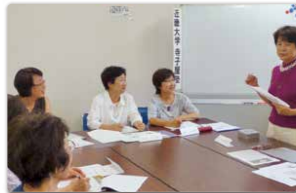
25年度前期「源氏物語」を原文で楽しむ読むを受講する皆さん

近畿大学「寺子屋塾」への私の憧れ...それは、大学の先生と話せる、同学の方々に会える...という「喜び」ゲットへの期待です。今、その期待は現実のものになっています。その場は、決して堅苦しい雰囲気ではなく、先生方のお人柄そして学びへの情熱...それらに魅せられて、同学の仲間が楽しく時間を共有しています。様々なヒントが一杯ある場でもあります。